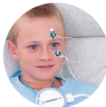
Sehr kurze Vorbereitungszeit dank aktiver Elektroden