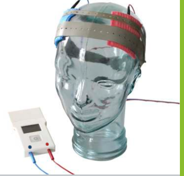
application du DC-STIMULATOR MOBILE