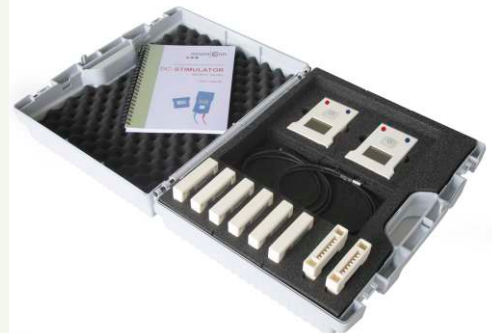
DC-STIMULATOR MOBILE - mallette avec pack de base