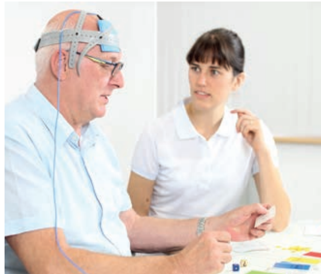
tDCS in der Aphasiotherapie